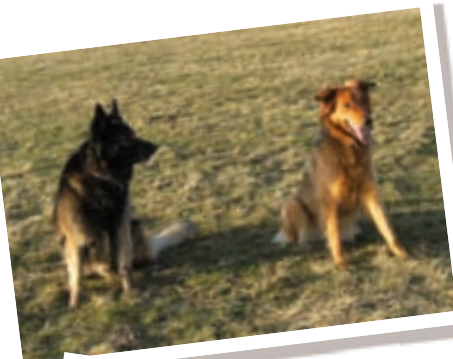
Unsere Hütehunde Blacki und Alina passen auf die Herde auf

Wir bieten Fleisch- und Wollerzeugnisse aus ökologischer Tierhaltung.